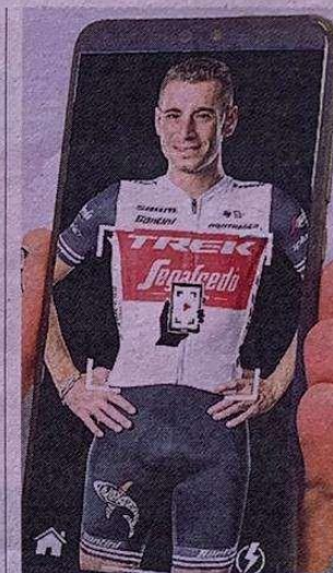
Identità Il logo con lo Squalo o la sua immagine, e parte l'App Vizual

Nibali vince anche in tecnologia ed è il primo big a sposare la nuova App Vizual per la «realtà aumentata». «Ragazzi, è una figata pazzesca: inquadrate il mio logo e via», dice il leader della