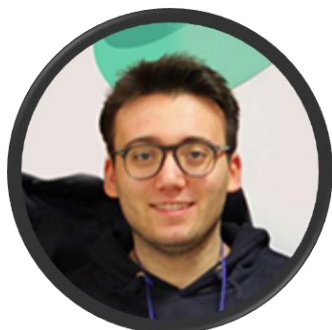
Salvatore Suriano Produzione